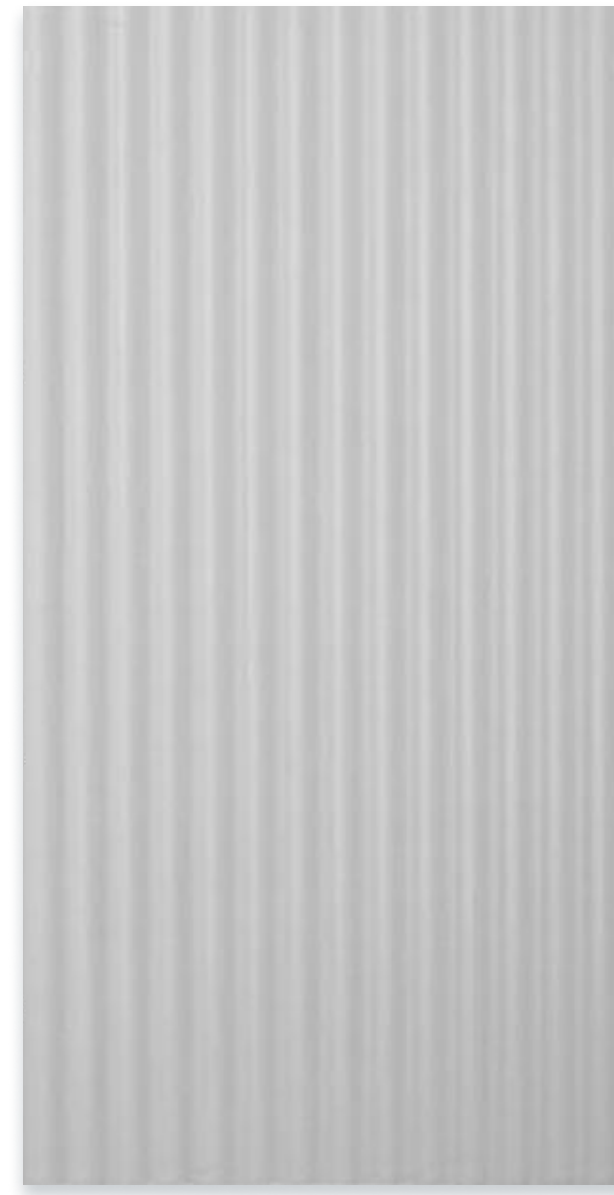
РИМ БЕЗ РУЧКИ