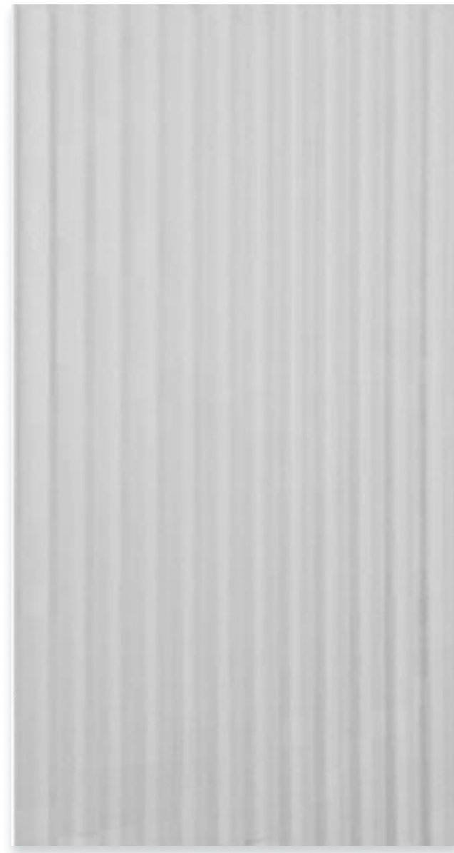
ОЛИМПИА БЕЗ РУЧКИ